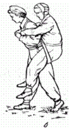
Рис. 69. Переноска пораженного на ляжке (первый способ) а — ляжка надета на пораженного; б — переноска пораженного на ляжке, сложенной восьмеркой